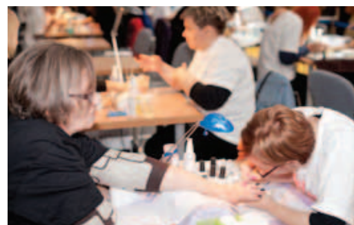
Uczestniczki Mistrzostw Manikiuru Hybrydowego „Black & White”