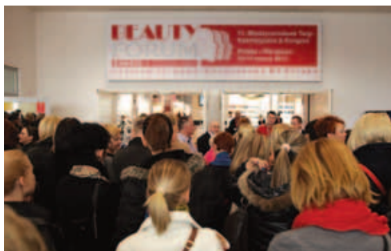
Odwiędziło nas ok. 10 000 osób! W warsztatach i seminariach uczestniczyło blisko 900 profesjonalistów