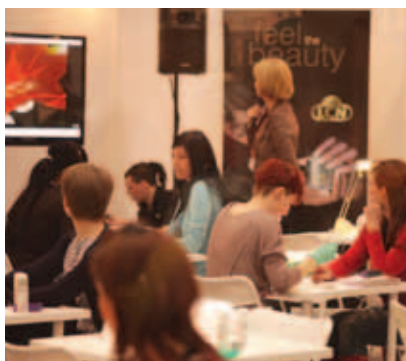
Podczas warsztatów stylistki doskonalily umiejętności z zakresu frencza i lakieru hybrydowego