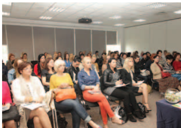
Podczas wielu wykładów sale pękały w szwach