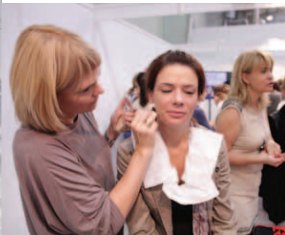
Warsztaty – makijaż w praktyce – Uczestniczki wykonywały perfekcyjne makijaże pod okiem międzynarodowego autorytetu – Vanessy Ventura Garcia