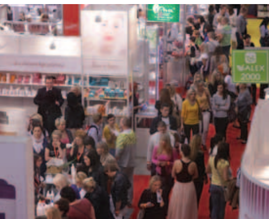
Rekordową edycję targów odwiedziło 8500 zwiedzających